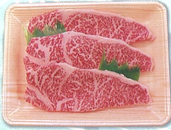
商品画像は 3枚入の画像です。

しまね和牛は2022年10月に鹿児島県で開催された「第12回全国和牛能力共進会」(和牛オリンピック)において、花形とされる総合評価群「6区」のうち肉質を審査する部門で1位を獲得するなど高い評価をいただきました。その肉はきめが細かく、深いコクと風味豊かな味わいが特徴です。神話のふるさと島根の美しい自然と豊かな風土が育んだ逸品になります。